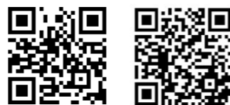
嘉義旌旗資訊 線上奉獻